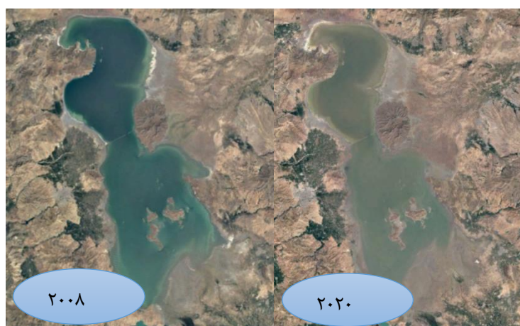
شکل ۱: تغییرات دریاچه‌ی ارومیه طی سری زمانی (۲۰۲۰-۲۰۰۸) (Google Earth pro, 2020).